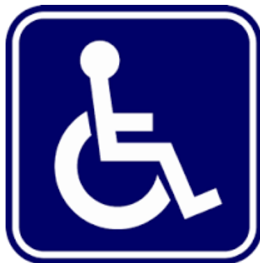
สัญลักษณ์ผู้พิการ